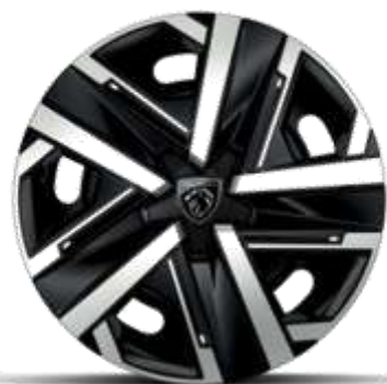
Jante de oțel SILOM de 16"