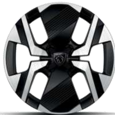
Jante diamantate bi-ton KARAKOY din aliaj de 17"

Standard pe nivelele de echipare ALLURE și GT