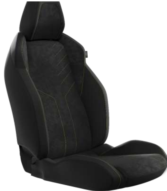
Tapîțerie Mistral "ICONIUM" Alcantara® cu tapîțerie TEP "Isabella" și cusături de culoare verde