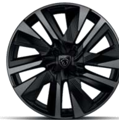
Jante diamantate bi-ton EVISSA din aliaj de 18"

Opțional pe nivelul de echipare GT (NU cu Pachet de iarna)