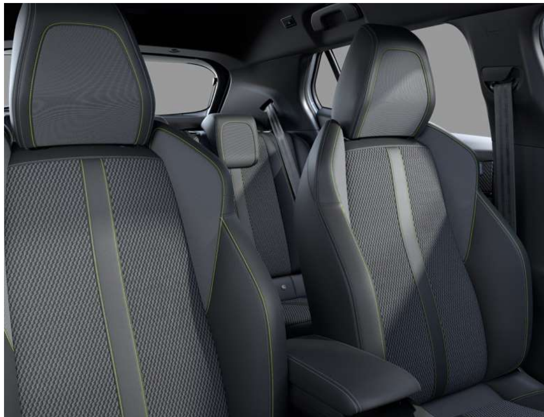
Tapîțerie din țesătură "BELOMKA", cu TEP "Isabella" și cusături de culoare verde