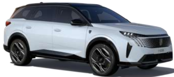
Alb 'Okenite' SUM0 - Optional