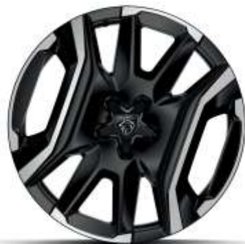
Jante aliaj „diamond cut” de 19” FUJI’