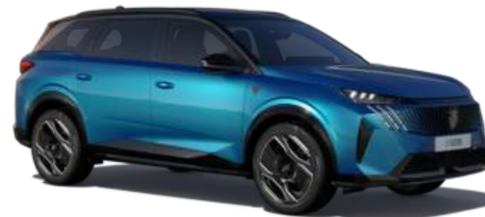
Albastru 'Obsession' DPM0 - Standard