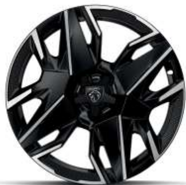
Jante aliaj „diamond cut” de 19” ‘YARI’

Standard pe ALLURE & GT (Electric & Plug-in Hybrid)