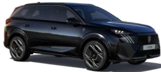
'Negru' Perla Nera' 9VM0 - Optional