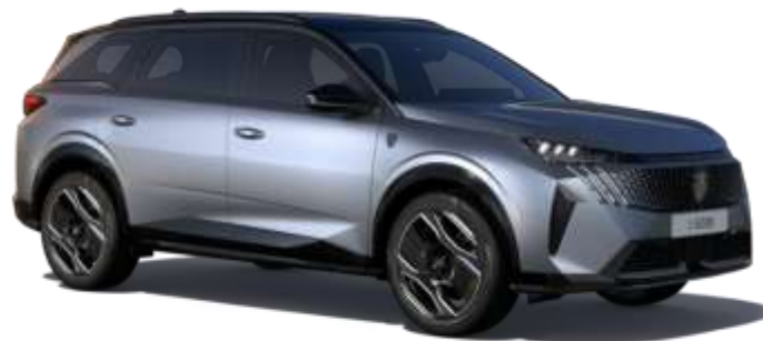
Gri 'Artense' F4M0 – Optional