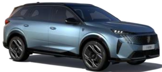
Albastru 'Ingaro' 7KM0 – Optional