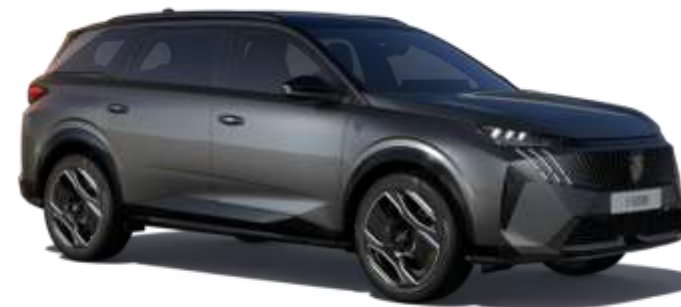
Gri 'Titane' 1JM0 - Optional