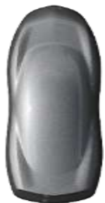
Gri Artense metallic