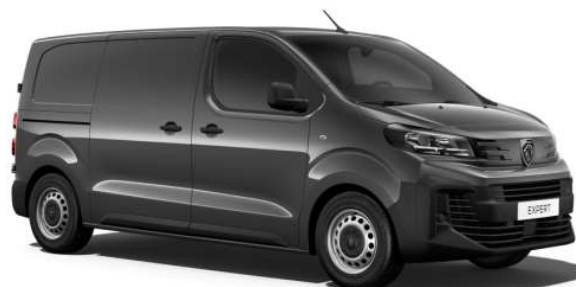
Imagini cu titlu de prezentare