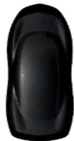
Negru 'Perla Nera' metallic