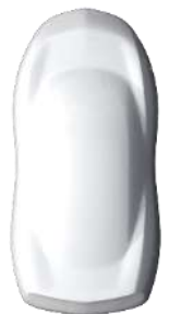
Alb 'Blanc Icy' (Standard)