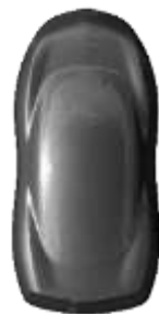
Gri 'Titanium' metallic